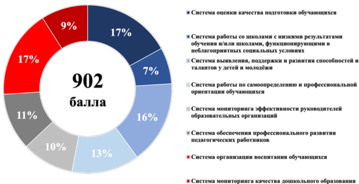
Рисунок 3 – Структура итогового балла

Максимальный итоговый балл по результатам проведения Оценки составляет 902. Структура итогового балла представлена на рисунке 3. Максимальные баллы по направлениям представлены в таблице 1.