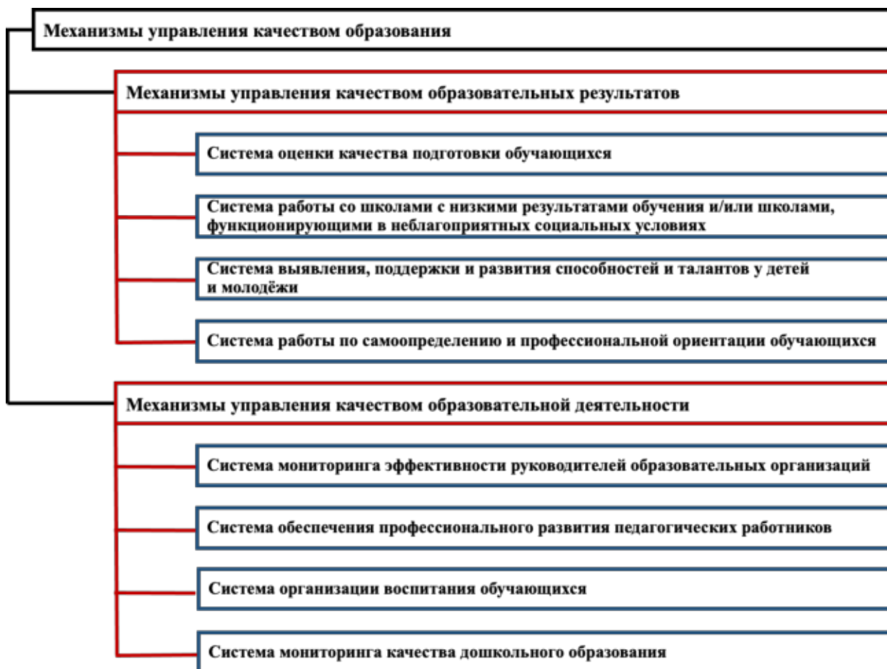
Рисунок 1 – Направления оценки

Направления Оценки представлены на рисунке 1.